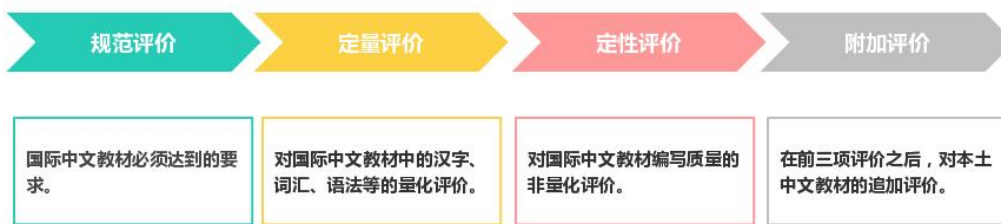
图1 国际中文教材评价结构图

《标准》包含价值取向、教学适用、内容编排、外观配置4个一级指标，20个二级指标，85个三级指标（如图2和表1—4）。